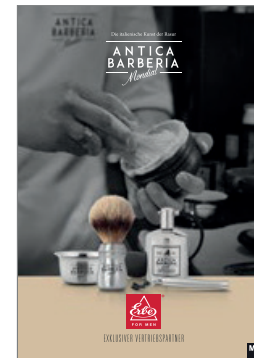
Antica Barberia Luxuriöse Rasierpflegeserie aus Italien