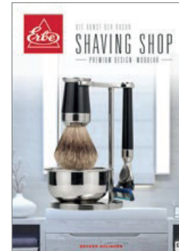
Shaving Shop Modular modulare ERBE Rasier-Sets Premium Design