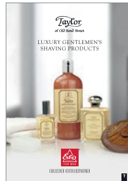
Taylor of Old Bond Street feinste Rasurkosmetik aus England