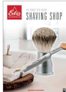
Shaving Shop ERBE Rasier-Accessoires